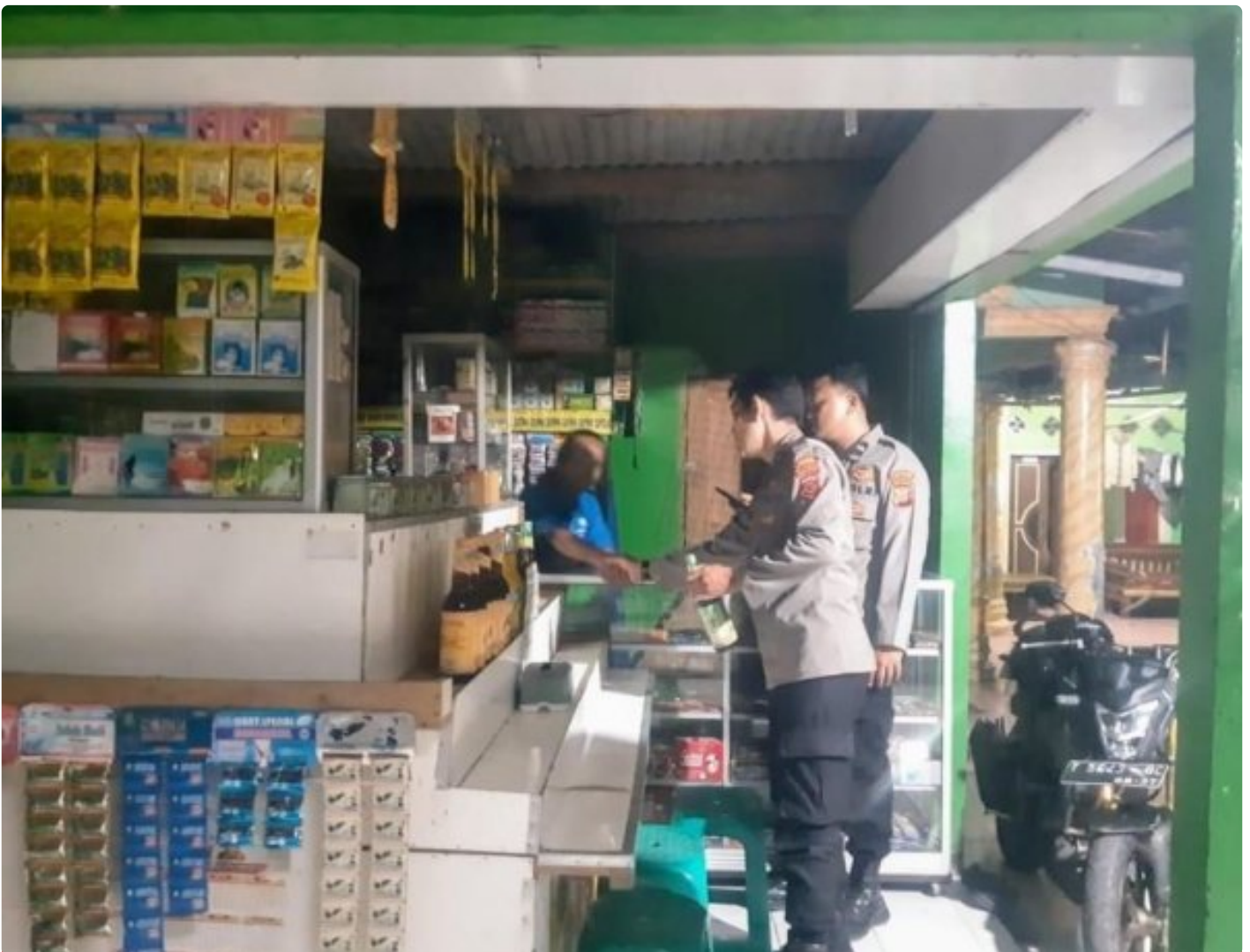
Anggota Polsek Tirtajaya Gencar melaksanakan Razia Miras Oplosan diwilayah Hukum Polsek Tirtajaya

Polres Karawang Polda Jabar, - Polsek Tirtajaya Polres Karawang Polda Jabar, untuk meminimalisir dan menekan peredaran Minuman Keras (Miras) terutama